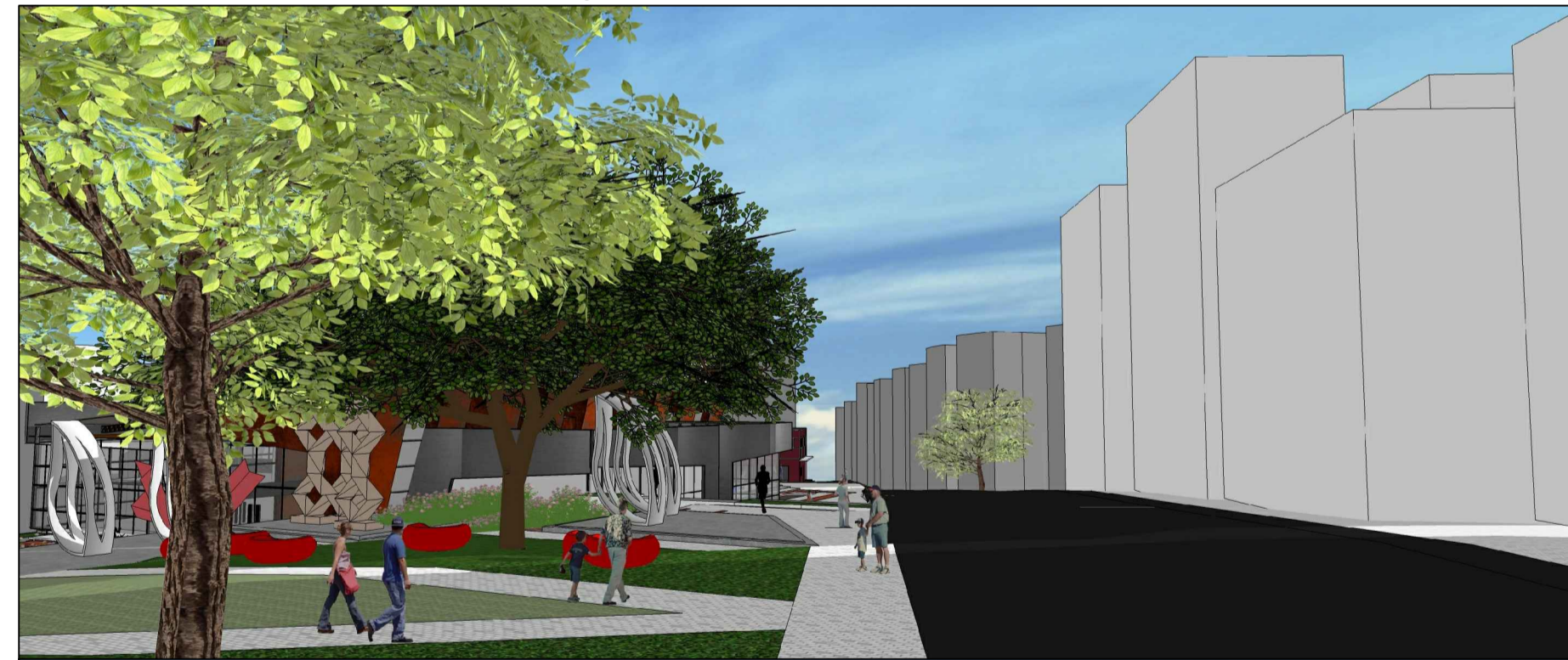
PERSPECTIVA DA AVENIDA DOS IMIGRANTES