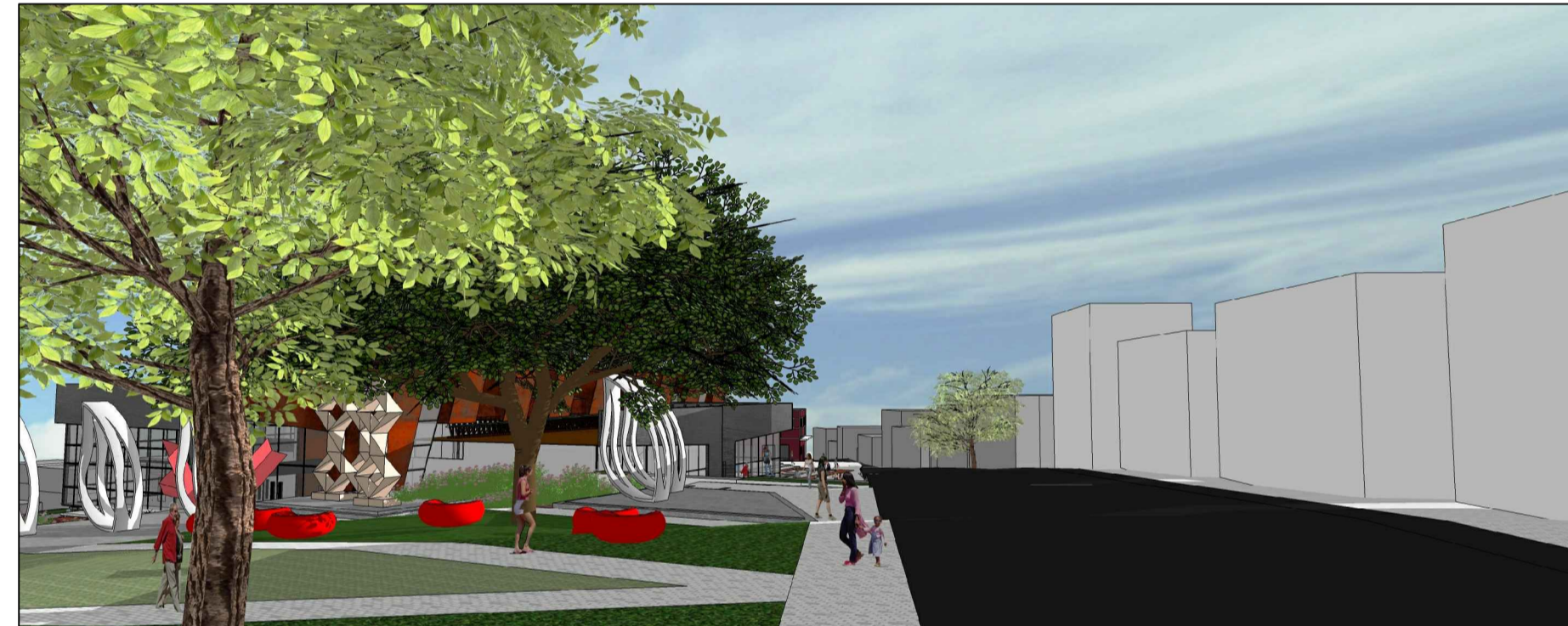
PERSPECTIVA DA AVENIDA DOS IMIGRANTES