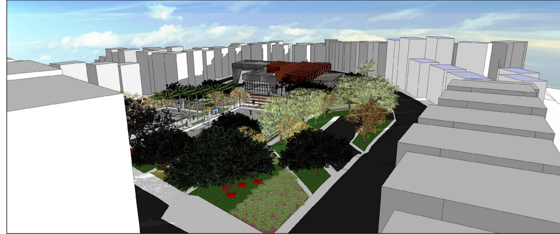
PERSPECTIVA GERAL DA PROPOSTA