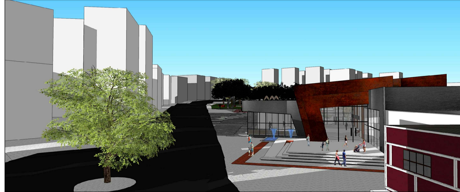
PERSPECTIVA DA RÓTULA